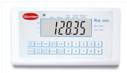
Visore a 3 LCD 25mm facile lettura Easy to read 3 large LCD 25mm