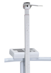
Statimetro telescopico/ Telescopic height rod 60~200cm